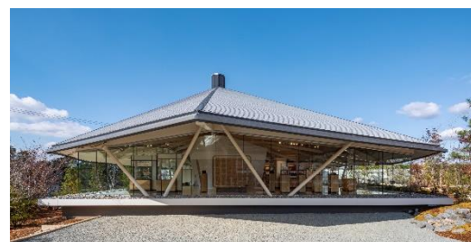
企業資料館「成寿殿」外観

の、コロナ禍により企業資料館の活用を自粛せざるを得ない状況が続きました。当社の社名、「ナリス化粧品」は、栄養を与える「nourishment」に由来し、ふきとり化粧水の「コンク」は、濃縮を意味する「concentrate」からの造語で、まさに濃縮された栄養化粧品を開発したいという創業者の思いが込められたものです。企業資料館に展示している唯一現存する発売当時の「ナリス コンク」のボトルは、その思いを象徴するものであり、そのボトルデザインを復元した限定アイテムをきっかけとして、コロナを経て化粧品との向き合い方が変わった今、リアルでの感受性の必要性を再確認するために、企業資料館や同敷地内の研修センターを活用していきたいと考えます。