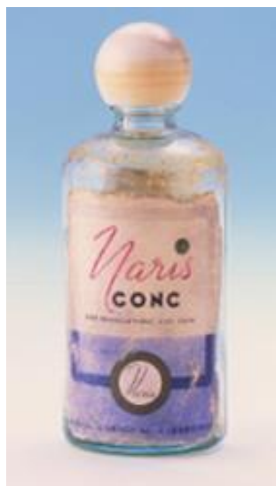
1937年発売 ナリス コンク

株式会社ナリス化粧品(本社：大阪市福島区 代表取締役社長：村岡弘義)は、1937年に当社はじめてのふきとり化粧水「ナリス コンク」を発売。以降90年近くにわたり、角層研究を続けています。初めて調査を行った2015年以降、ふきとり化粧水の国内シェアは8年連続No.1です ※1 が、ふきとり化粧水の技術の象徴である「ナリス コンク」のボトルデザインを復元し、数量限定で6月21日から、訪問販売及び全国のナリス化粧品店舗と通販で数量限定発売します。これは、コロナ禍を経て化粧品への向き合い方が変わった今だからこそ、リアルで感じることの重要性を再確認するために開発したものです。尚、中身の化粧水は、当時を復元したものではなく、当社の現在の主力ふきとり化粧水である「マジスタ コンク α」です。 ※1 調査会社：TPCマーケティングリサーチ株式会社 調査期間：2015年4月～2023年3月 調査実施：2023年4月