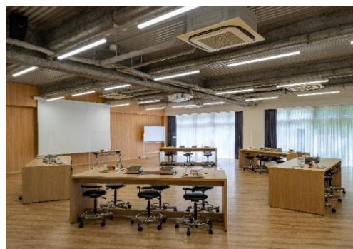
研修センター内 体験ラボ

1932年創業の当社は、昨年度が90周年にあたりましたが、その年に向けて企業資料館「成寿殿」をオープンし、創業者の化粧品開発にかける情熱や、過去から現在までの当社の取り組みを公開することで、安心して化粧品を使用いただくことを目的としていました。2021年2月10日の「ふきとりの日」にオープンしたも